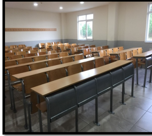
A- B Blok Derslikleri