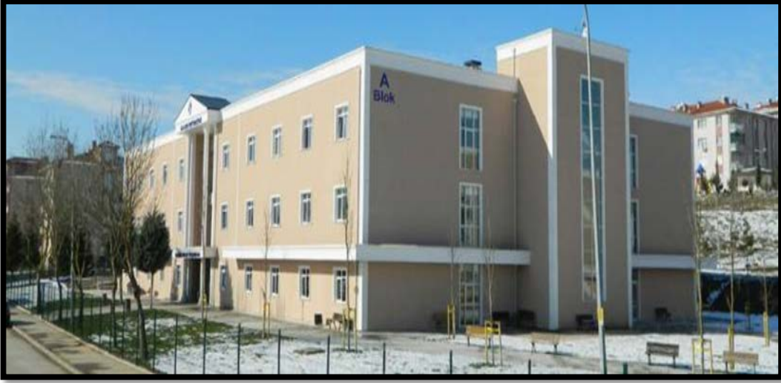
Şekil 1: Sakarya Meslek Yüksekokulu Binası