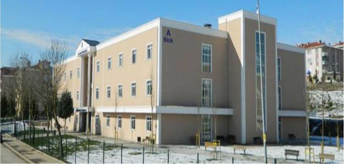
Sakarya Meslek Yüksekokulu Binası