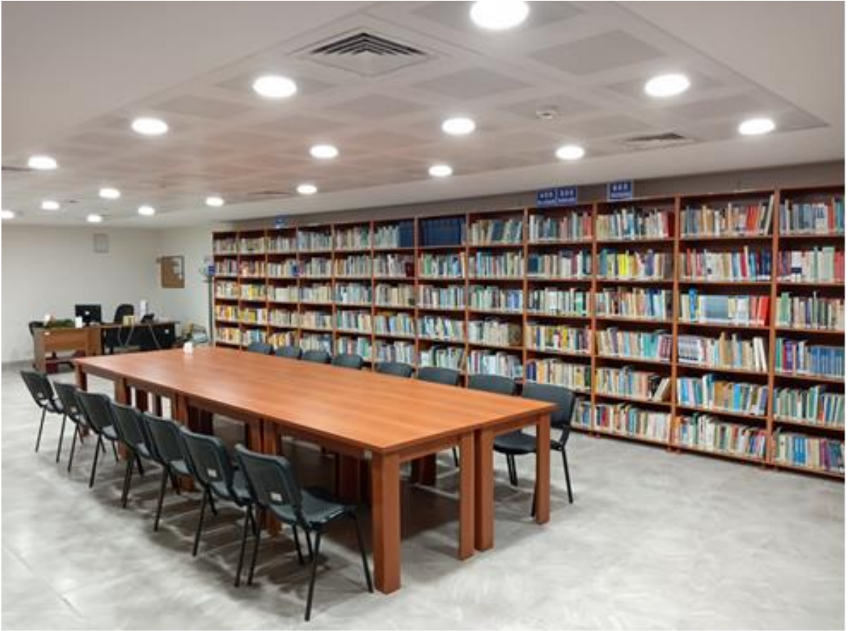
Sakarya Meslek Yüksekokulu Kütüphanesi