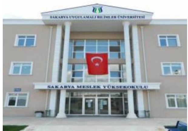
Şekil 1. MYO Yerleşkesi