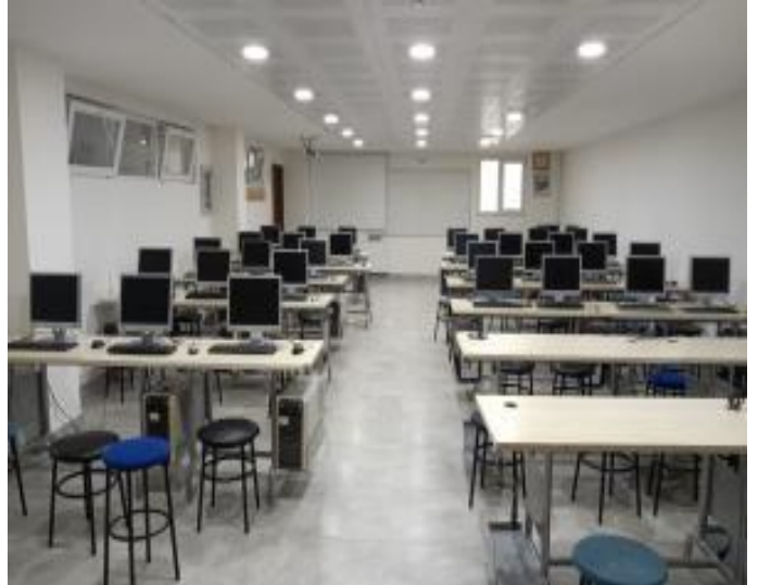
Şekil 2. Derslik ve laboratuvarları