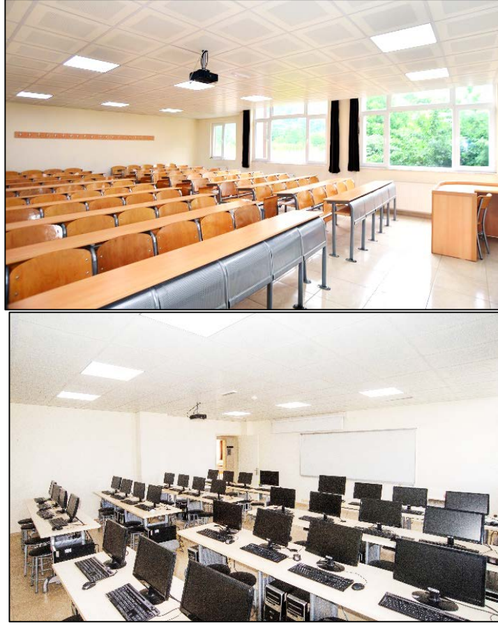
Şekil 2. Derslik ve laboratuvarlarımız

Bölgeye belediyenin 22C, 22D, 22K ve 23 numaralı araçları ile gidilebilmektedir fakat bu araçlar için belediye kartı çıkartmak gerekmektedir. Ayrıca minibüslerle ulaşım da yapılabilmektedir. Öğrencilere ait bir otopark yoktur.