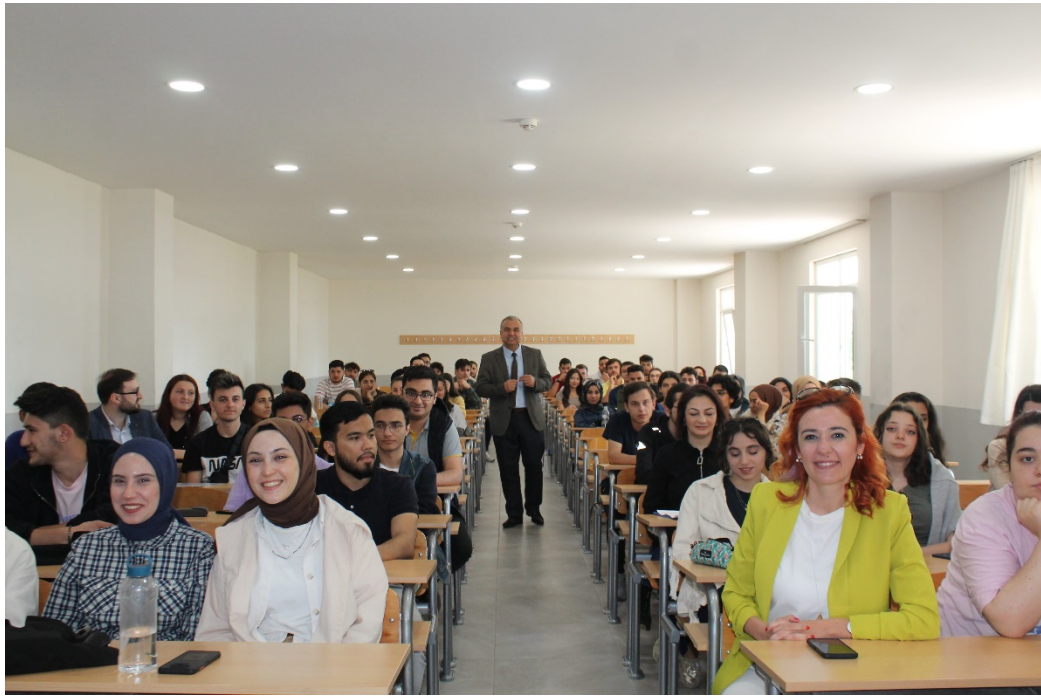
Şekil 1. MYO Yerleşkemiz