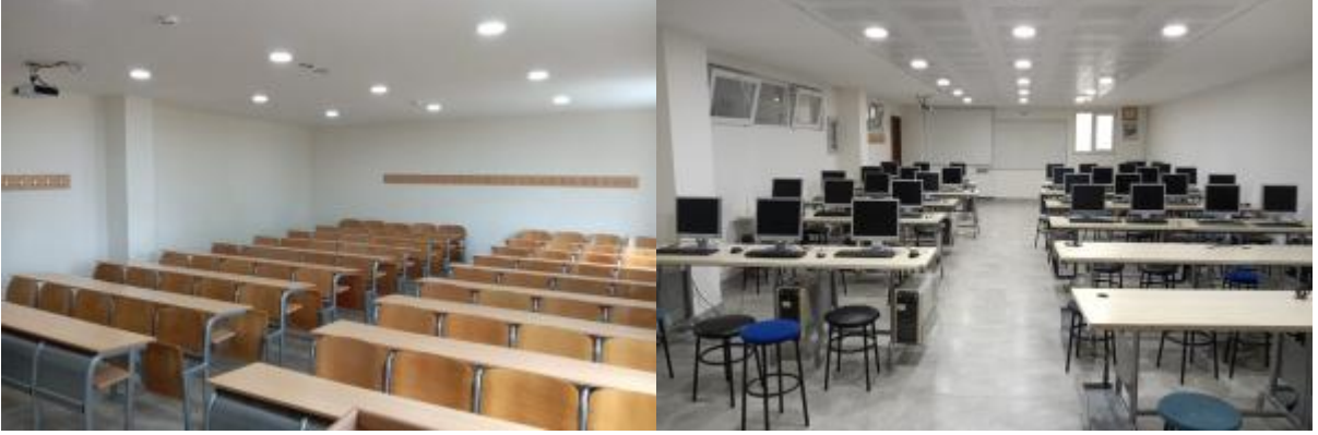
Şekil 2. Derslik ve laboratuvarlarımız

Okulumuzda 24 adet derslik, 5 adet teknik resim salonu, 5 adet bilgisayar laboratuvarı ve 5 adet de bölüm laboratuvarı bulunmaktadır.