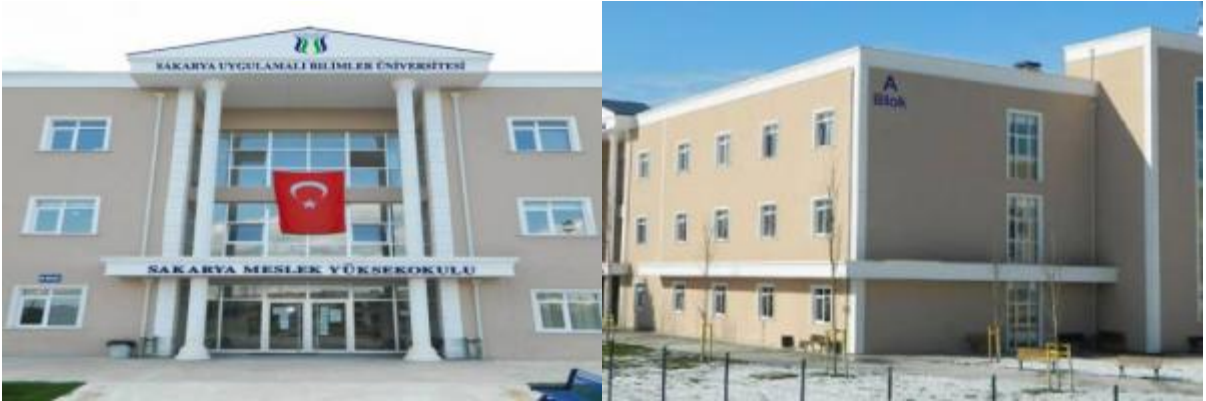
Şekil 1. MYO Yerleşkemiz

Mesleki eğitim-öğretimde hedeflediği yüksek kalite standartlarıyla mezunlarına uygulama becerisi kazandırma yetkinliği ile ulusal ve uluslararası düzeyde adından söz ettiren; iş dünyası ile iş birliği içinde geleceğin nitelikli işgücü ihtiyacını karşılamaya yönelik etkili çözümler üreten, takım çalışmasını teşvik eden, demokratik, şeffaf, iletişime ve değişime açık bireyler yetiştirmek amacımızdır.