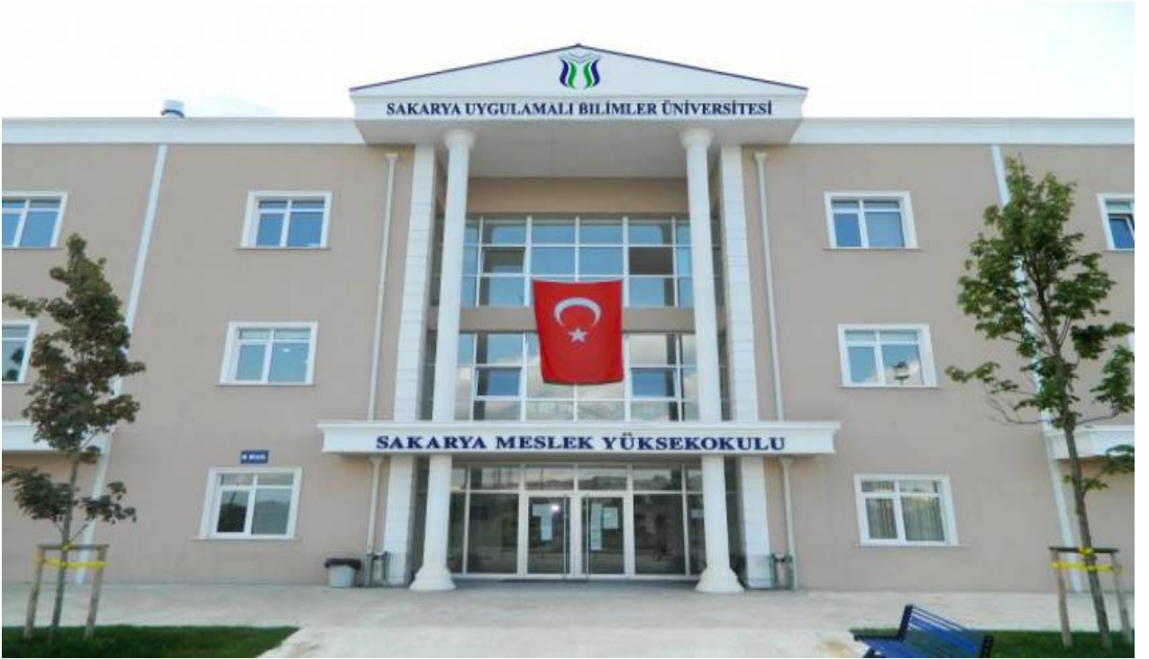
Şekil 1. MYO Yerleşkemiz

Okulumuz belirli mesleklere yönelik nitelikli insan gücü yetiştirmek için, Sakarya Meslek Yüksekokulu adıyla 1976 yılında eğitim-öğretime açılmıştır. 20 Temmuz 1982 tarih ve 41 sayılı Yükseköğretim Kurumları hakkında Kararname ile 1982 yılında İstanbul Teknik Üniversitesi (İTÜ) bünyesinde Sakarya Mühendislik Fakültesine bağlanmış, 1992 yılında ise Sakarya Üniversitesi bünyesine alınmıştır. 18.05.2018 tarihinde yayımlanan 7141 Sayılı Kanun kapsamında Sakarya Uygulamalı Bilimler Üniversitesinin kurulması ile Sakarya Meslek Yüksekokulu adı ile Üniversitemiz bünyesine alınan okulumuz eğitim öğretim faaliyetlerine Camili yerleşkesinde devam etmektedir. Toplamda 2 bloktan oluşan Sakarya Meslek Yüksekokulunda binalar 2 katlı olup zemin katta ve 1. katta derslikler ve bilgisayar laboratuvarları, toplantı salonları ve kütüphane bulunmaktadır. 2.katta ise öğretim elemanı odaları yer almaktadır.