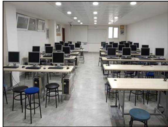
Şekil 2. Derslik ve laboratuvarlarımız