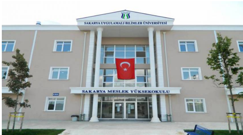
Şekil 1. MYO Yerleşkemiz

Ayrıca öğrenciler, teorik bilgilerin yanında 3+1 (+1) Eğitim Modeli ile bir dönem işletmelerde tam zamanlı çalışarak uygulamaya yönelik iş deneyimi elde etmek fırsatı bulmaktadırlar.