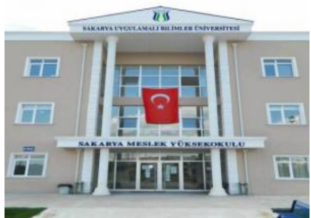
Şekil 1. MYO Yerleşkesi