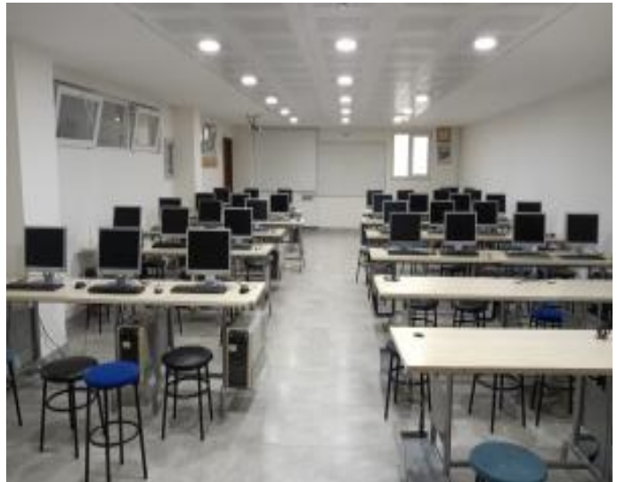
Şekil 2. Derslik ve laboratuvarları