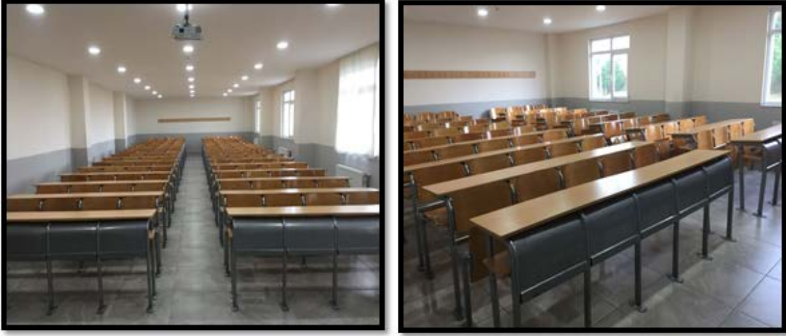
Görsel 2. Dersliklerimiz

Bilgisayar laboratuvarları başta Bilgisayar Programcılığı öğrencileri olmak üzere diğer program öğrencilerinin de kullanımına açıktır. Bölümümüzde programcılık tabanlı dersler, grafik tasarım, veritabanı, ofis yazılımları alanında okutulan dersler bilgisayar laboratuvarlarında yürütülmektedir.