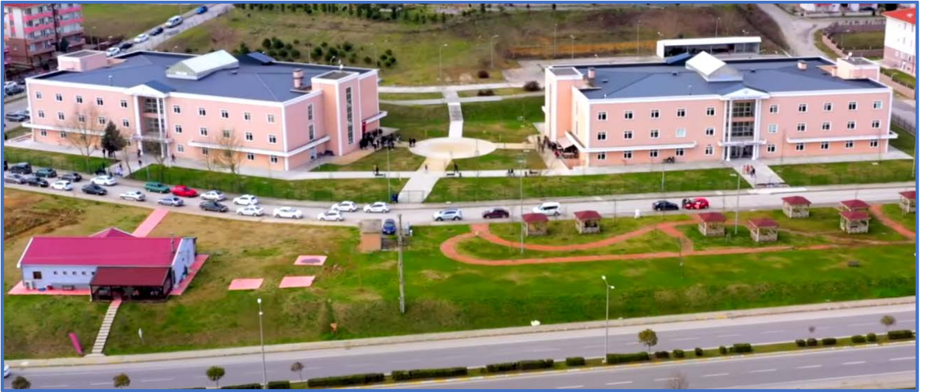
Görsel 1. MYO Yerleşkemiz

Bilgisayar Programcılığı Programı, lise eğitiminden sonra ön lisans programı olarak iki yıllık bir eğitim sunmaktadır. Öğrenciler, ilgili meslek lisesi mezunları veya lise mezunları arasından Öğrenci Seçme ve Yerleştirme Merkezi (ÖSYM) tarafından yapılan Yükseköğretim Kurumları Sınavı (YKS) ile seçilmektedir. Bilgisayar Programcılığı programının I. Ve II. öğretimi bulunmaktadır.