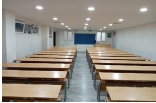
Şekil 2. Derslik ve laboratuvarlarımız