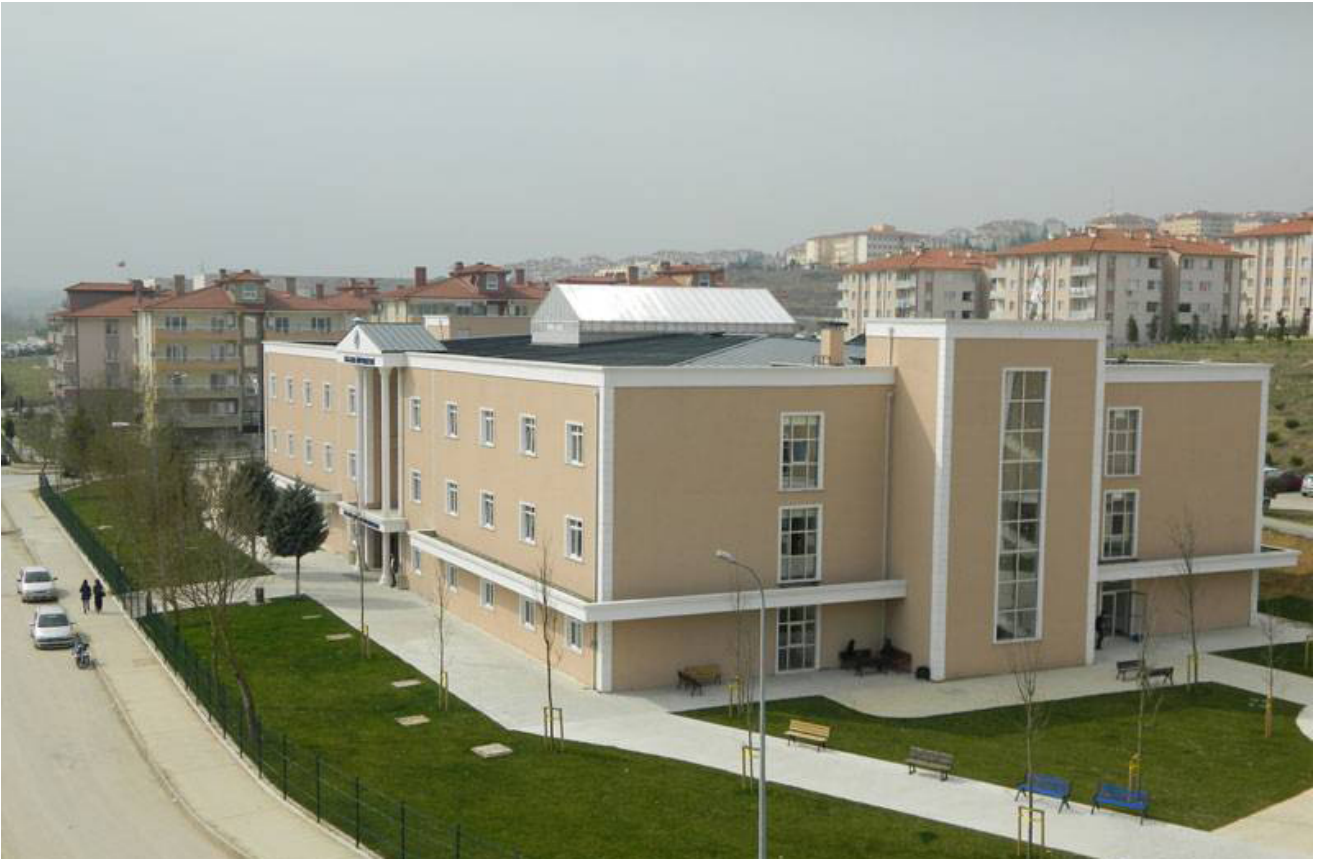
Şekil 1. MYO Yerleşkemiz

Sakarya Uygulamalı Bilimler Üniversitesi Sakarya Meslek Yüksekokulu Gazetecilik ve Habercilik Bölümü olarak Basın ve Yayıncılık Programı adıyla 2008 yılında eğitime başlamıştır. YÖK tarafından yapılan düzenlemeyle 2020 yılından itibaren Basım ve Yayım Teknolojileri programı adıyla birinci ve ikinci öğretim olmak üzere eğitim verilmektedir. Basın, basım, yayın ve yayım süreçlerine hakim, etik ilkeleri, hukuk kurallarını benimsemiş kamu menfaati odaklı hizmetler üreten, bilgi teknolojilerini etkin kullanabilen, mesleğin gerektirdiği bilgi ve beceriye sahip, planlı ve sistemli çalışma alışkanlığı kazanmış, analitik düşünebilen mesleki yetkinliğe sahip elemanlar yetiştirmeyi amaçlamaktadır.