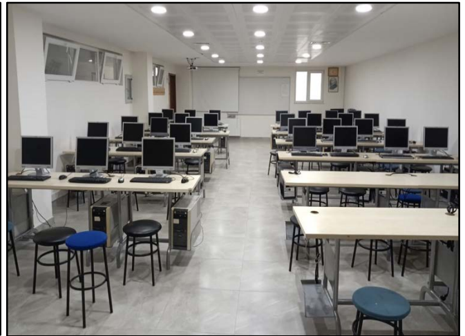
Şekil 2. Derslik ve laboratuvarlarımız