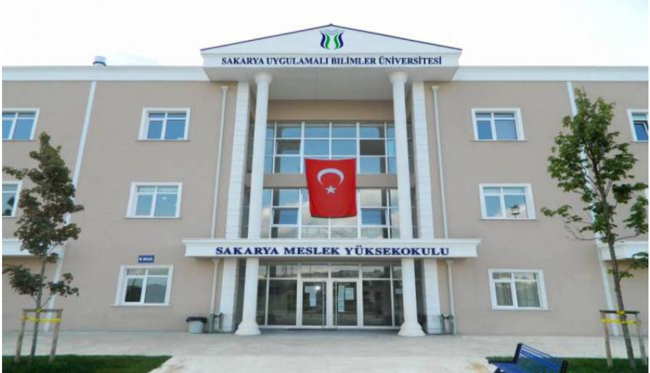
Şekil 1. MYO Yerleşkemiz

Okulumuz belirli mesleklere yönelik nitelikli insan gücü yetiştirmek için, Sakarya Meslek Yüksekokulu adıyla 1976 yılında eğitim-öğretime açılmıştır. 20 Temmuz 1982 tarih ve 41 sayılı Yükseköğretim Kurumları hakkında Kararname ile 1982 yılında İstanbul Teknik Üniversitesi (İTÜ) bünyesinde Sakarya Mühendislik Fakültesine bağlanmış, 1992 yılında ise Sakarya Üniversitesi bünyesine alınmıştır. 18.05.2018 tarihinde yayımlanan 7141 Sayılı Kanun kapsamında Sakarya Uygulamalı Bilimler Üniversitesinin kurulması ile Sakarya Meslek Yüksekokulu adı ile Üniversitemiz bünyesine alınan okulumuz eğitim öğretim faaliyetlerine Camili yerleşkesinde devam etmektedir. Toplamda 2 bloktan oluşan Sakarya Meslek Yüksekokulunda binalar 2 katlı olup zemin katta ve 1. katta derslikler ve bilgisayar laboratuvarları, toplantı salonları ve kütüphane bulunmaktadır. 2.katta ise öğretim elemanı odaları yer almaktadır.